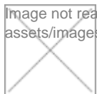
Image not readable or empty assets/images/1/17.%20VLV_aero-variante-aa356550.jpg Image not readable or empty assets/images/0/16.%20VLV_entree-variante-aa356550.jpg

Image not readable or empty assets/images/4/15.%20VLV_aero-variante-a4d72c74.jpg